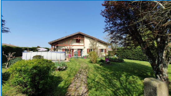
Coup de cœur

Référence 811 Viager occupé. Proche de LIBOURNE (10 minutes) , village tous commerces, au calme, maison d'environ 130 m 2 habitables sur un terrain de 1100 m 2 .